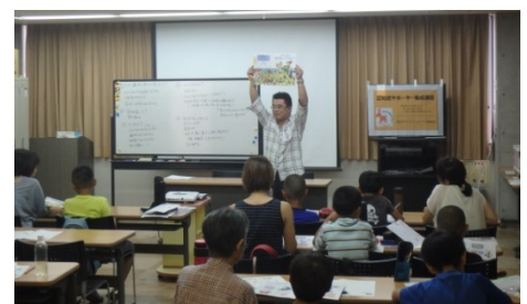
昨年度の開催の様子